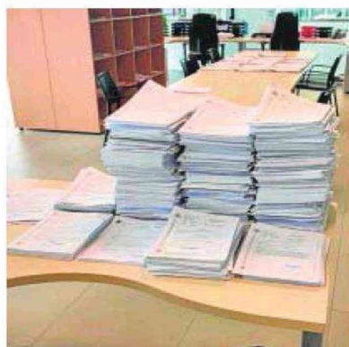
Expedientes acumulados, togas colgadas en señal de protestas y pasillos vacíos, consecuencias del parón. c7

En este escenario, las noticias que llegaban desde Madrid no eran positivas, puesto que la reunión que mantuvieron representantes del Ministerio con los secretarios de Gobierno –los superiores de los letrados de la administración de Justicia–, no arro-