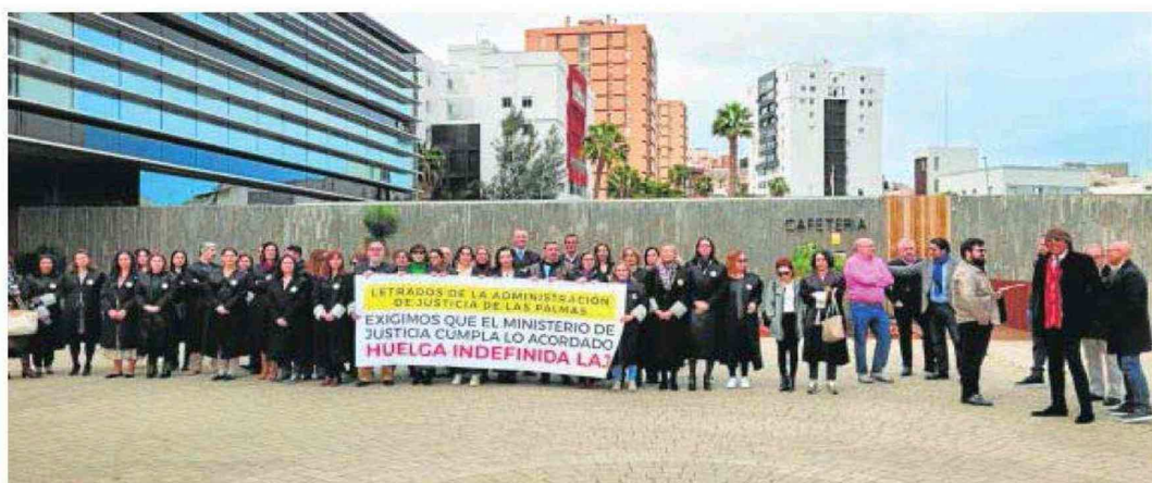
En la imagen, la concentración de los letrados que tuvo lugar este miércoles en la Ciudad de la Justicia. c7